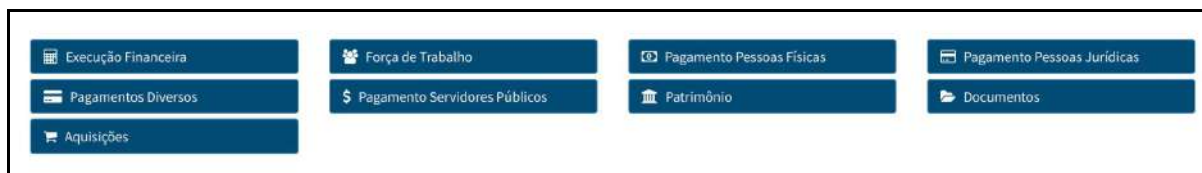
Figura 01 - tela de informações apresentadas pelo portal da transparência da Faurgs

A transparência ativa, apresentando as informações de forma agrupada, indica um ganho de eficiência, pois o IFRS ainda não dispõe de um sistema de apresentação de todos esses dados de forma agrupada, dos seus projetos. Inclusive, os dados sobre os projetos do IFRS executados com o apoio da fundação de apoio, são extraídos do portal da transparência da fundação e apresentados no Portal do IFRS 2 . Para o IFRS apresentar os dados sobre os projetos da forma semelhante aos apresentados pela fundação de apoio implicaria no desenvolvimento de novos sistemas de informação.